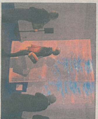
Auf den Leinwänden schwappt das Wasser in den Raum.

bel JMT (Jazz Music Today), das wiederum Stefan Winter 1985 gegründet hatte. Winter ist Autodidakt, arbeitete seit den frühen 80er Jahren mit Musik, Geräuschen, Klanglandschaften und Video. Gemeinsam gründeten sie die Musik Edition Winter & Winter. Die Aufnahmen des interdisziplinären Labels wurden im In- und Ausland ausgezeichnet, darunter mit dem Jahrespreis der Deutschen Schallplattenkritik. 2019 rief das Künstlerpaar die gemeinnützige Neue Klangkunst ins Leben, eine Initiative mit dem Ziel, neue Räume für die Klangkunst zu schaffen. Auch abseits der Ausstellungsräume sind die beiden gefragt: So arbeiteten sie bereits mehrfach mit dem Regisseur Werner Herzog zusammen.