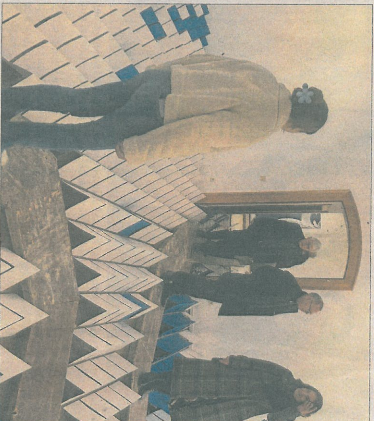
Ein Meer aus weiß-blauen Zellen erwartet die Besucher in der Galerie. Zehn Tage dauerte der Aufbau.

Komplett verschwunden waren die roten Bodenfliesen – mal unter der Klebefolie und mal unter einem Meer aus weiß-blauen Kartons. Diese hatten die Künstler zu Zellen gefaltet. Die Installation ließ viel Platz für Interpretationen. Blau für die Welle, Weiß für die Gischt wäre eine Variante. Und Chaubal wusste noch zwei weitere: „Weiß-blau kann für Bayern stehen, mit dem Rot der