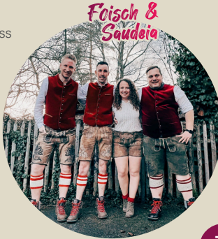
Foisch & Saudeia