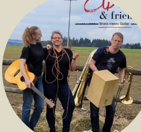
Eibers & Friends