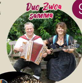
Duo Zwoa samma